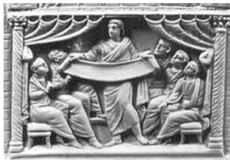
Marción desplegando su canon

Si Marción no hubiese actuado de esta manera, desafiando el pensamiento de sus contemporáneos, el proceso de fijación del canon hubiera sido mucha más lento y no se habría alcanzado el mismo grado de precisión en la definición de algunos temas.